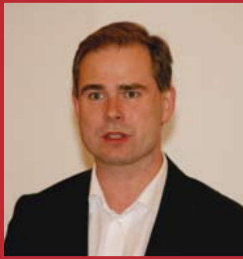
Borgmester Nicolai Wammen Socialdemokraterne