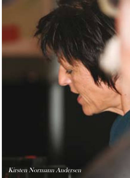
Kirsten Normann Andersen