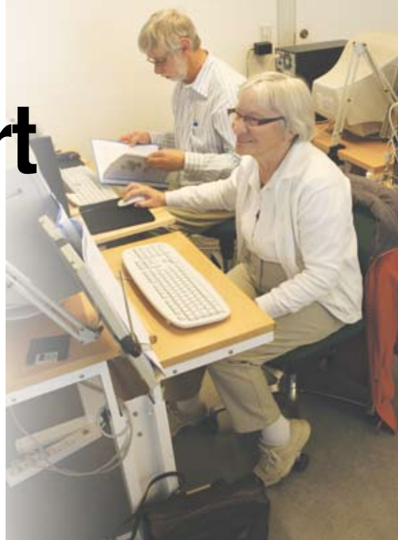
På IT-kursus – til gavn for ældrearbejdet i Tranbjerg